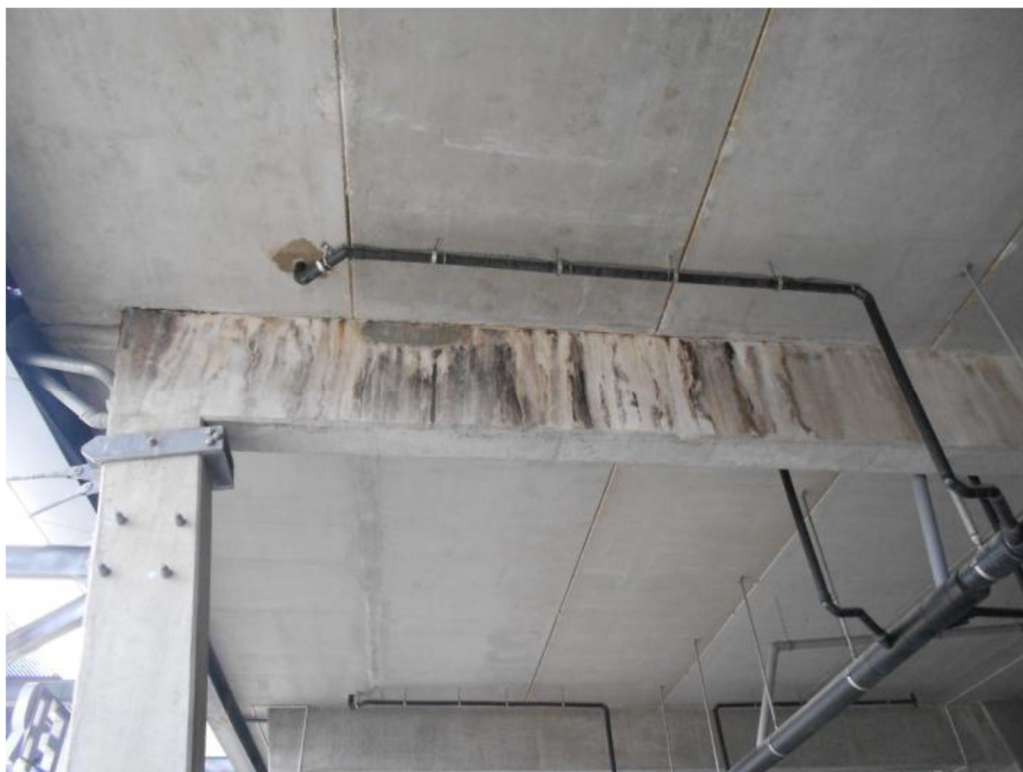
III trybuna - powierzchnia belki pod promenadą ze śladami korozji